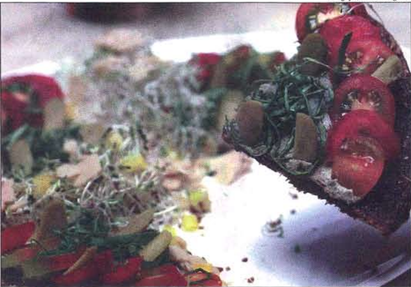
■ A PIZZA do Universo Orgânico, feita com pão dos essênios com patê de nori, couve, tomate e brotos