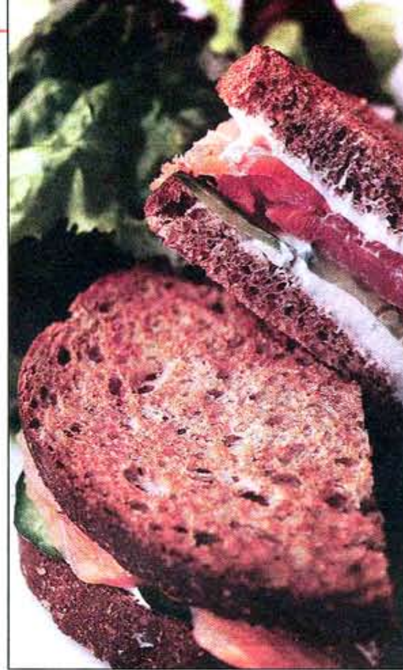
■ O SANDUÍCHE de salmão marinado no pão preto, com pepino, creme azedo e dill, do Market